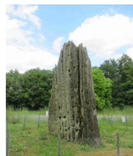
Menhir de Pierrefitte