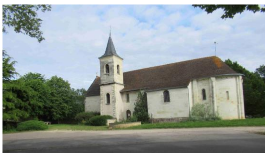
Eglise romane Ste Julitte