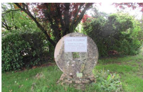
Stèle de la famille Plourde