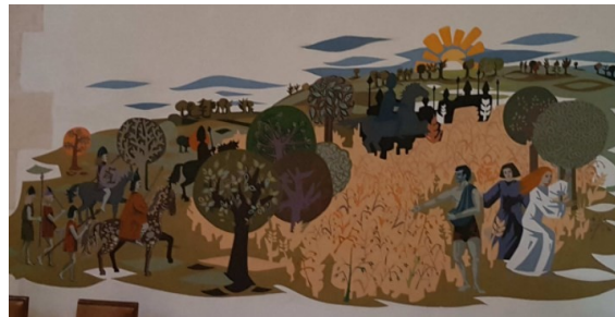
Ste Radegonde, miracle des avoines