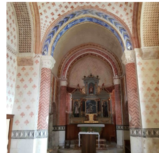
Eglise de Mazeuil