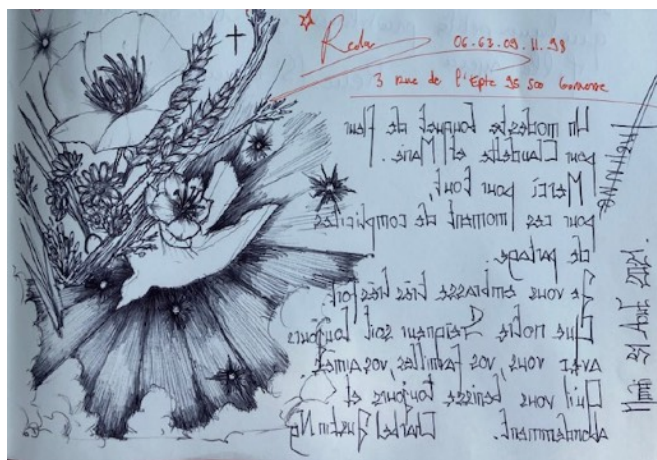
Joli dessin d'un pèlerin et texte en miroir à la manière de Léonard de Vinci !

La halte est un havre de paix et de silence. Ce matin, on entendait les oiseaux chanter dans la cour. Le tilleul est majestueux et me rappelle l'enfance dans mon village natal..