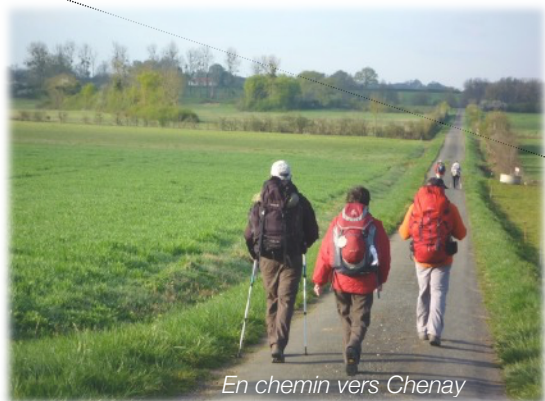
En chemin vers Chenay

Au km 10,5, départ d'un chemin de 1 km pour rejoindre St Sauvant.