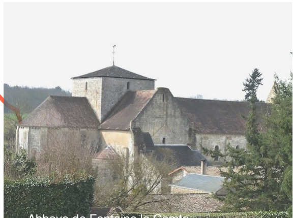
Abbaye de Fontaine le Comte