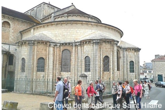
Chevet de la basilique Saint-Hilaire

Le tracé est en bleu quand il est balisé aux couleurs jacquaires jaune et bleu . Le tracé du chemin est en rouge quand il suit le GR 655, balisé en blanc et rouge