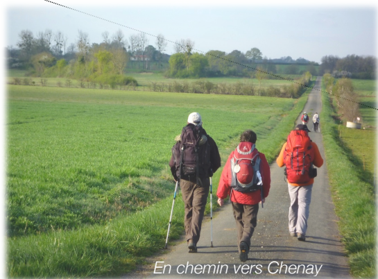
En chemin vers Chenay

Au km 10,5, départ d'un chemin de 1 km pour rejoindre St Sauvant.