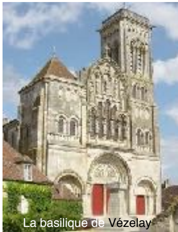
La basilique de Vézelay