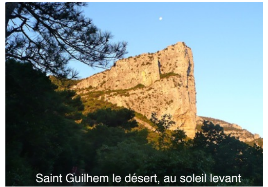
Saint Guilhem le désert, au soleil levant