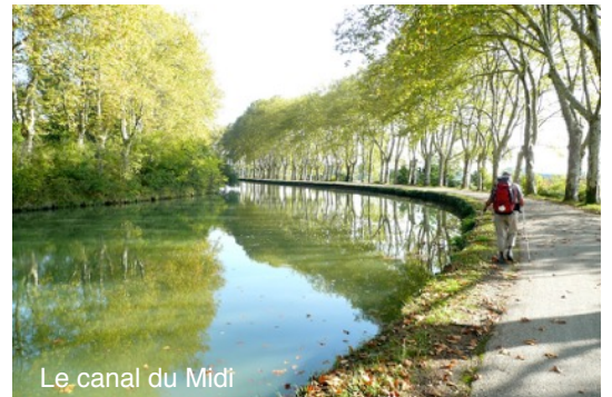
Le canal du Midi