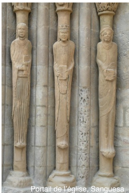
Portail de l'église, Sangüesa