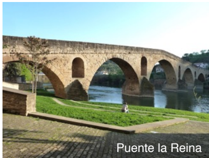
Puente la Reina