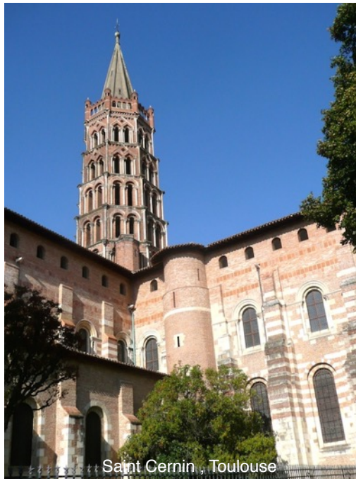
Saint Cernin, Toulouse