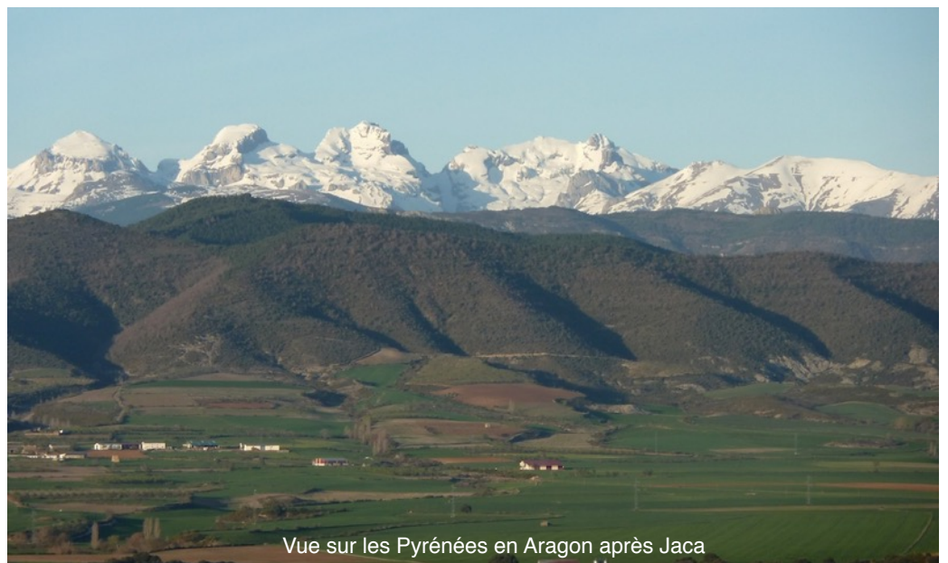
Vue sur les Pyrénées en Aragon après Jaca