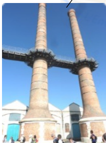
Les Cheminées de la « Manu »