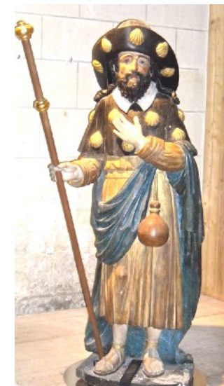
Pèlerin, statut du XVII e Eglise Saint Jacques

Ce document est mis gracieusement à disposition des pèlerins et des randonneurs. Ceux-ci utilisent les cheminements proposés sous leur propre responsabilité.